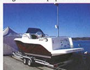
■ Cabin verzija je pogodna za duža krstarenja

punokrvni sportaš i ribolovac. Fascinantno prostrana unutrašnjost i velika nadkabina ne smetaju dimenzijama bočnih prolaza (27 cm), a i kokpit je povećao kvadrature. Tu se može organizirati jako dobar radni prostor, recimo montažom „borbenog stolca“ u rupu predviđenu za nogu stola. Kako je Orka 740 Pilot izuzetno okretna, a skiper ima jako dobar pregled situacije sa svog mjesta, nameće se kao dobar izbor brodicice s kojom ćete u bilo koju vrstu pučinskog ribolova. Sve tri verzije Orke 740, opremljene prosječno snažnim motorom, bez problema održavaju krstareću brzinu od oko 30 čvorova, što u prijevodu znači maksimalno sat vremena i do najudaljenijih pošti. A do tamo ćete istom brzinom i kad ima dosta valova. Jer ova brodicica to stvarno može. ■