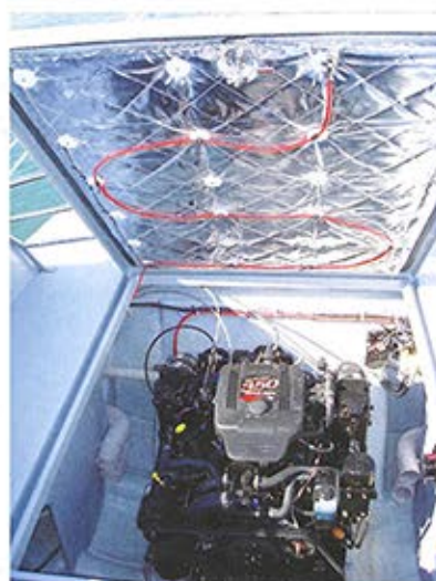
■ Pouzdani Yamahin dizelaš dobro je zvučno izoliran

nedostatak estetike kada se Orka 740 pogleda s boka. U prostoru ispod nje se nalazi wc s umivaonikom; dobrodošao detalj onima koji „to“ ne vole obavljati u more. Taj prostor može poslužiti i kao spremište, ali po brodicici ih je toliko puno da stvarno ne vidim razlog trpanja stvari preko umivaonika i wc školjke. Dakle, naprijed su četiri ogromna spremišta, poprečno pregrađena pomičnom pločom sa rupom na sredini, što u praksi znači da u njih možete staviti sve stvari koje želite ocijediti. Dalje se nastavljaju dva bočna, pa jedno koje se proteže cijelom širinom brodicice (za ronilačke boce), a zadnje je ono u skiperovoj klupi. Malo im je teže izračunati kubaturu, ali ne bi se začudio da je u rangu one dostavnog kombija. Kako god bilo, Orku 740 slobodno možete natovariti opremom, ne samo zbog raskoši skladišnog prostora, već i zbog konstrukcije brodicice koja dopušta takav teret, a da pri tome ne izgubi ništa od