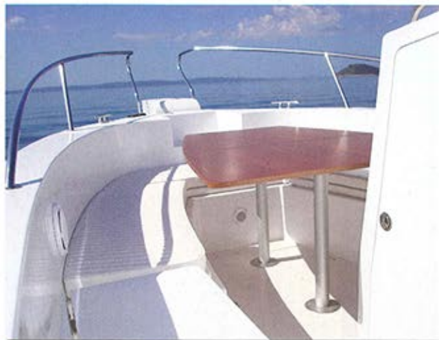
■ Varijanta prednjeg dijela kokpita sa stolom za objedovanje

■ U prostoru ispod upravljačke konzole smješteni su wc i umivaonik