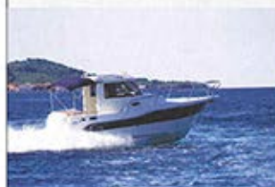
■ Pilot verzija - završni dio trilogije Orka 740

Kako ima onih koji bi na ovakvoj brodicici htjeli na malo duža krstarenja ili u ribolov u sva doba godine, na bazičnom su se trupu projektirale dvije verzije koje udovoljavaju tim uvjetima. I dok je Cabin verzija ipak malo više „ditaški“ nastrojena, Pilot je