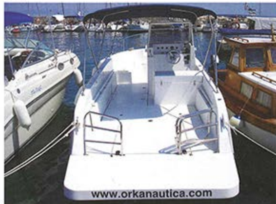
■ Sve što se digno na platformu, bez problema ulazi u kokpit kroz ovakva vrata