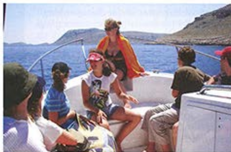
■ Na prednjem se dijelu smjestilo dosta putnika, a gužve nema na vidiku

nedostatak estetike kada se Orka 740 pogleda s boka. U prostoru ispod nje se nalazi wc s umivaonikom; dobrodošao detalj onima koji „to“ ne vole obavljati u more. Taj prostor može poslužiti i kao spremište, ali po brodicici ih je toliko puno da stvarno ne vidim razlog trpanja stvari preko umivaonika i wc školjke. Dakle, naprijed su četiri ogromna spremišta, poprečno pregrađena pomičnom pločom sa rupom na sredini, što u praksi znači da u njih možete staviti sve stvari koje želite ocijediti. Dalje se nastavljaju dva bočna, pa jedno koje se proteže cijelom širinom brodicice (za ronilačke boce), a zadnje je ono u skiperovoj klupi. Malo im je teže izračunati kubaturu, ali ne bi se začudio da je u rangu one dostavnog kombija. Kako god bilo, Orku 740 slobodno možete natovariti opremom, ne samo zbog raskoši skladišnog prostora, već i zbog konstrukcije brodicice koja dopušta takav teret, a da pri tome ne izgubi ništa od